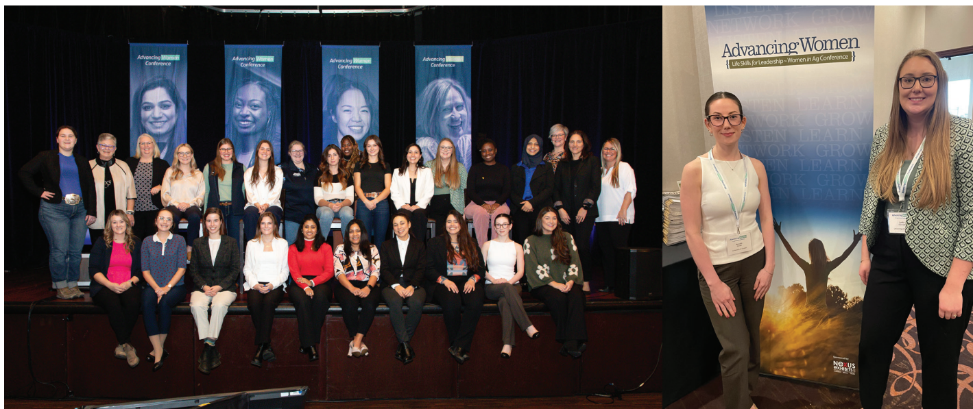
Étudiantes de la Conférence pour l'avancement des femmes en agriculture.